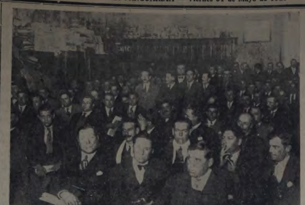
CONCURRENTES AL ACTO

Hay que evitar esas pérdidas de tiempo y de dinero, y al efecto, la C. D. no debe incluir más en la Memoria cuestiones banales que dan lugar a esos debates.