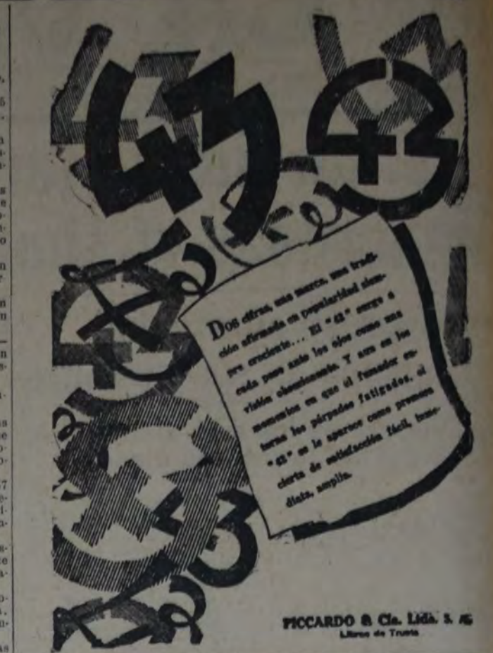
PICCARDO & Cia. Ltda. s. r. l. Libros de Trueta

5º Exhibición de la cinta cinematográfica de los Recreos Infantiles.