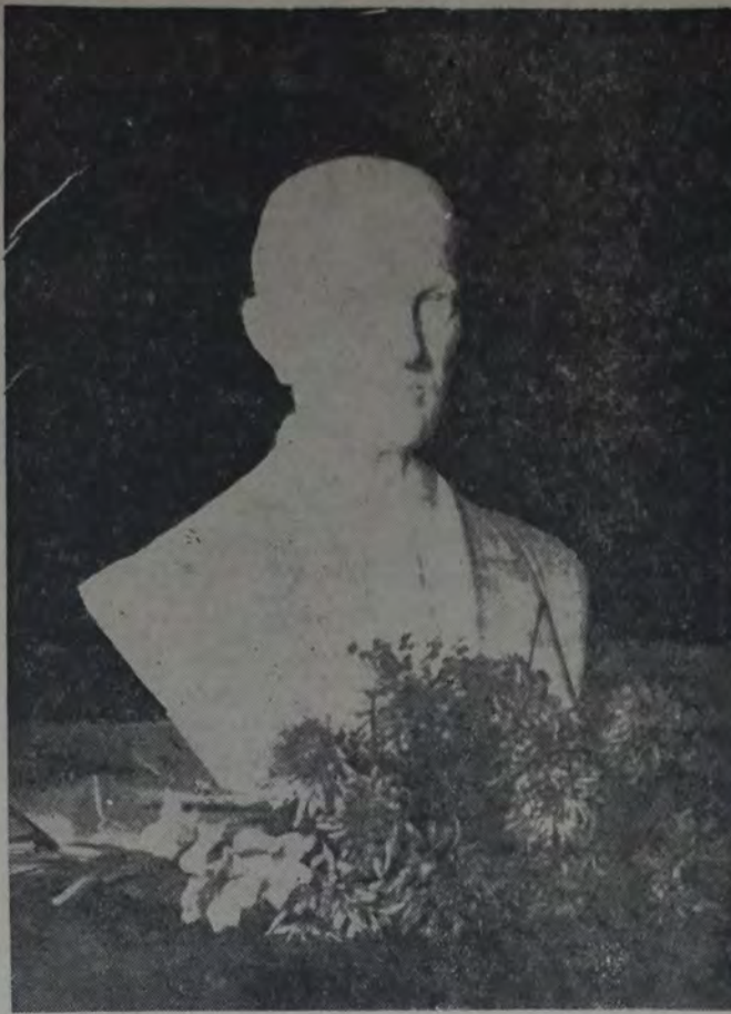
BUSTO DE MARMOL DEL INGENIERO MATEO LOVADINA

EL CONGRESO RESOLVIO QUE SE ENVIE UNA NOTA AGRADECIENDO A "LA VANGUARDIA" EL ENVIO GRATUITO DE EJEMPLARES DEL DIARIO