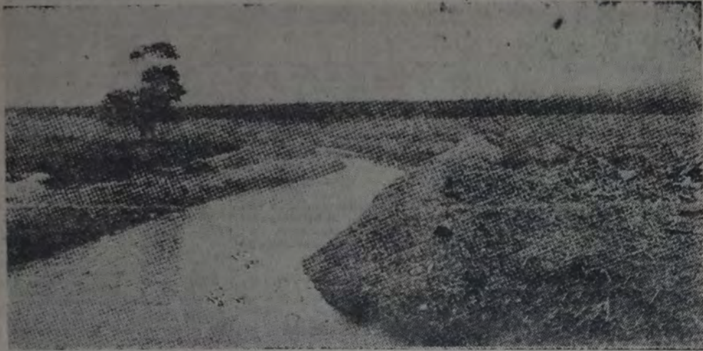
CAMPIÑA ANTES ESTERIL, HOY FECUNDA POR SUS CANALES DE RIEGO

tas por cada cuatro habitantes, como en los Estados Unidos, donde hay un automóvil por cada cuatro personas, existe el problema agrícola, siendo éste la preocupación de estadistas y políticos.